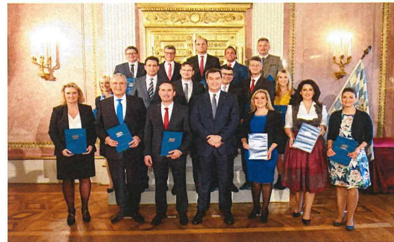
Das neue Kabinett