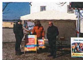
Unterschriftensammlung Abschaffung der "Strabs"