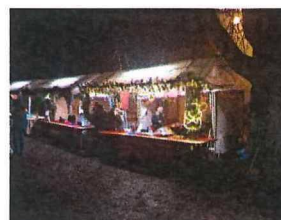
Mit einem Stand am Weihnachtsmarkt 2017

der Ortsgruppe Freie Wähler Kirchdorf a. Inn