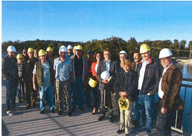
Foto auf dem Stauwerk Ering