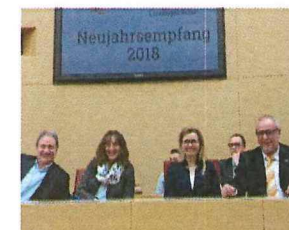
Neujahresempfang im Landtag