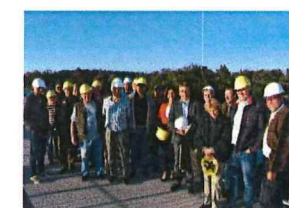
Betriebsbesichtigung Innstauwerk ERIK