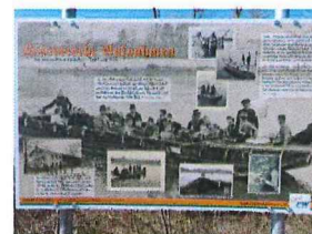
Stiftung einer Schautafel an der "Überfuhr"