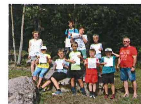
Teilnahme am Ferienprogramm