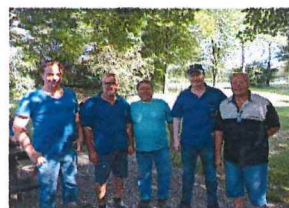
Teilnahme bei der Ortsmeister- schaft der Plattenwerfer