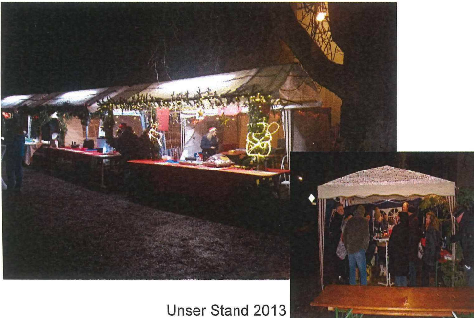
Unser Stand 2013

Bei den Mitgliedern sehr gut angenommen wurde der